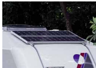
Solaranlage, bestehend aus einem 75-W-Modul, Ladestromregler