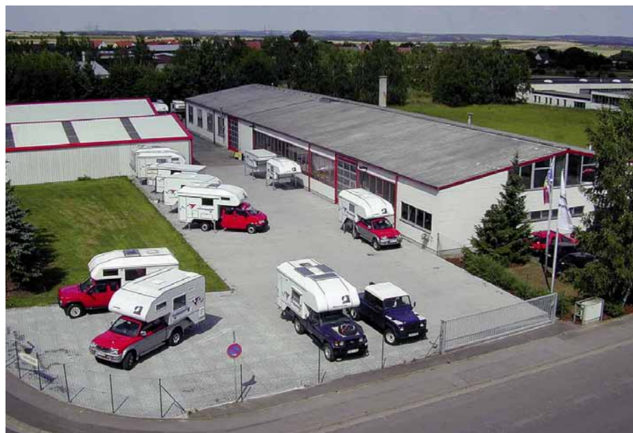
Werkgelände der Tischer Freizeitfahrzeuge in Kreuzwertheim

Das Werk in Kreuzwertheim beschäftigt zur Zeit 20 Mitarbeiter. Pro Jahr werden etwa 140 Reisemobilkabine produziert.