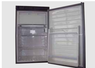
Kompressorkühlschrank Coolmatic MDC 65, 65 Liter und Coolmatic MDC 90, 90 Liter