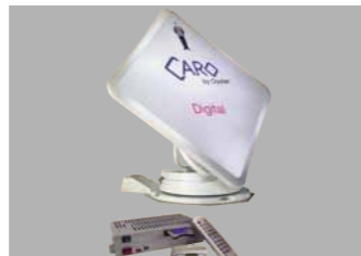
Sat-Anlage mit Receiver