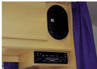
Radio/CD, Stereo, mit Antenne und 2 Lautsprechern