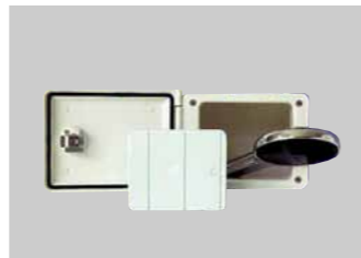
Isolierte Durchreiche für Dusche