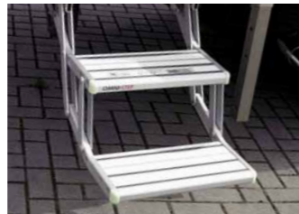
Elektrische Einstiegsstufe, 2-stufig, 12 V