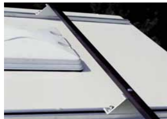
Dachträgersystem mit Leiter