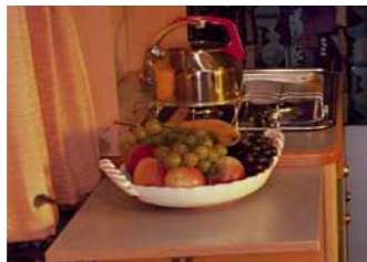
Zusätzliche Klappbare Arbeits- oder Ablagefläche