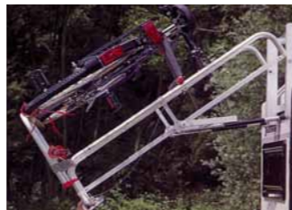
Fahrradträger klappbar oder festmontiert für 2 Fahrräder