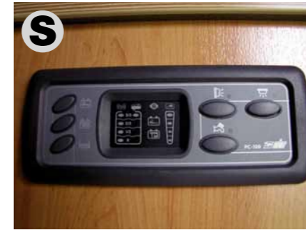
Bord-Control-System für Frisch- / Abwassertank, Aufbau- / Fahrzeugbatterie, 12-V-Hauptschalter und Wasserpumpenschalter. (nicht bei TRAIL / BOX 200)