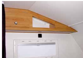
Alkovenhängeschränk rechts oder links mit Ablagebord