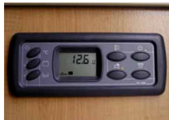
Digitales Bord-Control-System mit Aussen- und Innentemperatur-Anzeige, Zeituhr und optionalem Aussenlicht-Schalter