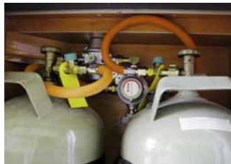
Gasregler-Anlage Truma DuoComfort