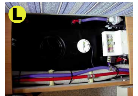
80 Liter Frischwassertank