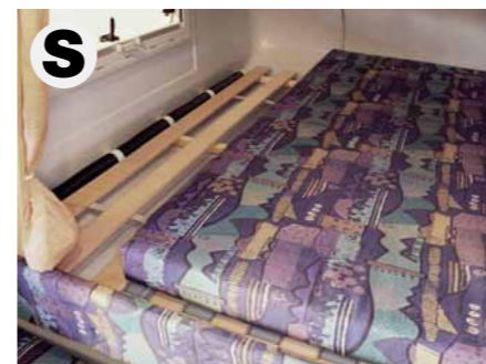
Liegfläche mit Lattenrost und Warmluftführung (Warmluftführung nicht bei TRAIL / BOX 200)