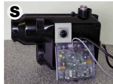
Truma E-2400 (In Serienausstattung enthalten bei TRAIL / BOX 200)