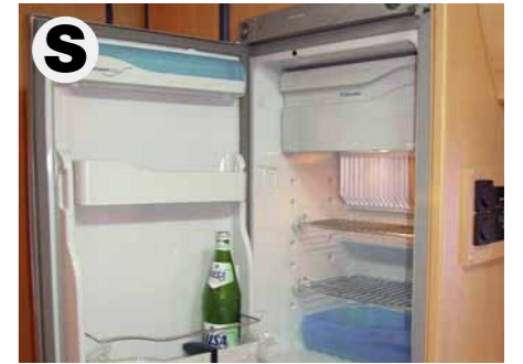
Absorberkühlschrank Dometic RM 7361 L, 88 Liter. (In Serienausstattung enthalten bei TRAIL / BOX 200)