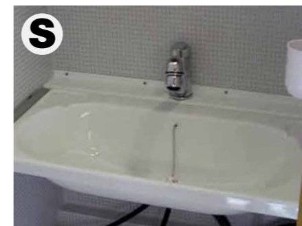
Klapp-Waschbecken (nicht bei TRAIL / BOX 200)