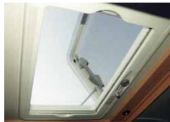
Panorama-Dachluke Seitz-Heki 1