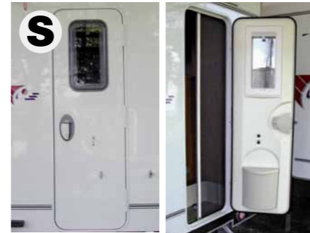
Eingangstüre mit Sicherheitsschloss und Moskitorollo