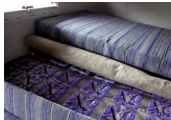
Froli Star und weichere Matratze