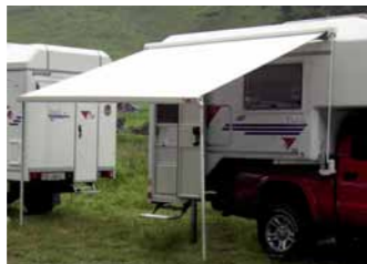
Markise rechts oder links, 3 m