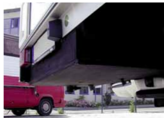
Abwassertank, isoliert und beheizt