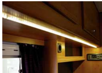
LED Paket (LED-Beleuchtung, zusätzl. Beleuchtung Hängeschränke, Sitzbank dimmbar)