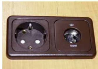
Einbau zusätzlicher Steckdose 230 V oder Einbau Steckdose 12 V