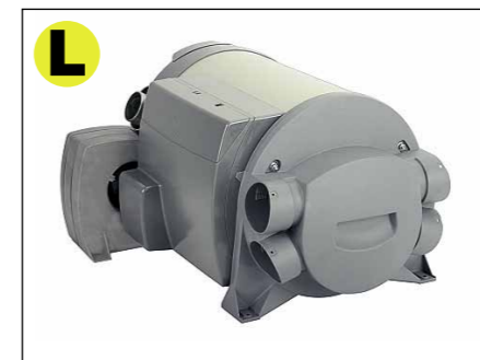
Heizung Truma Combi 4