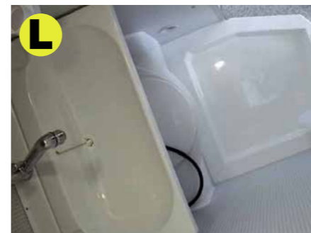
Waschraum mit Duschwanne und Cassetten-Toilette