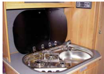
Kocher-Spüle-Einheit, 3-flammig mit elektronischer Zündung und 2-teiliger Glasabdeckung