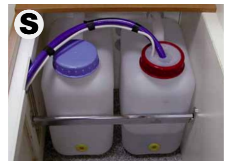
2 x 15 Liter-Kanister