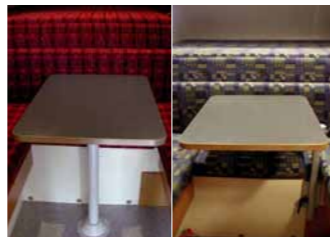
Aluminium-Schwenktisch (Bild rechts) anstelle Einsäulentischfuss (Bild links)